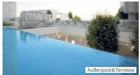
Außenpool & Terrasse